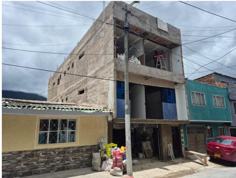
IMAGEN 3: FACHADA LATERAL